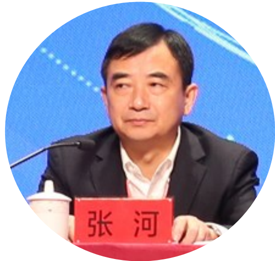
张河作联合会章程(草案)和会费说明

第四章组织机构。明确联合会的权力机构是会员大会,理事会是会员大会的执行机构,常务理事会是理事会的日常代表机构,同时设立了监事。具体规定会员大会、理事会、常务理事会和监事的职责以及会长、副会长、秘书长的职责。此外专门设特邀理事单位。