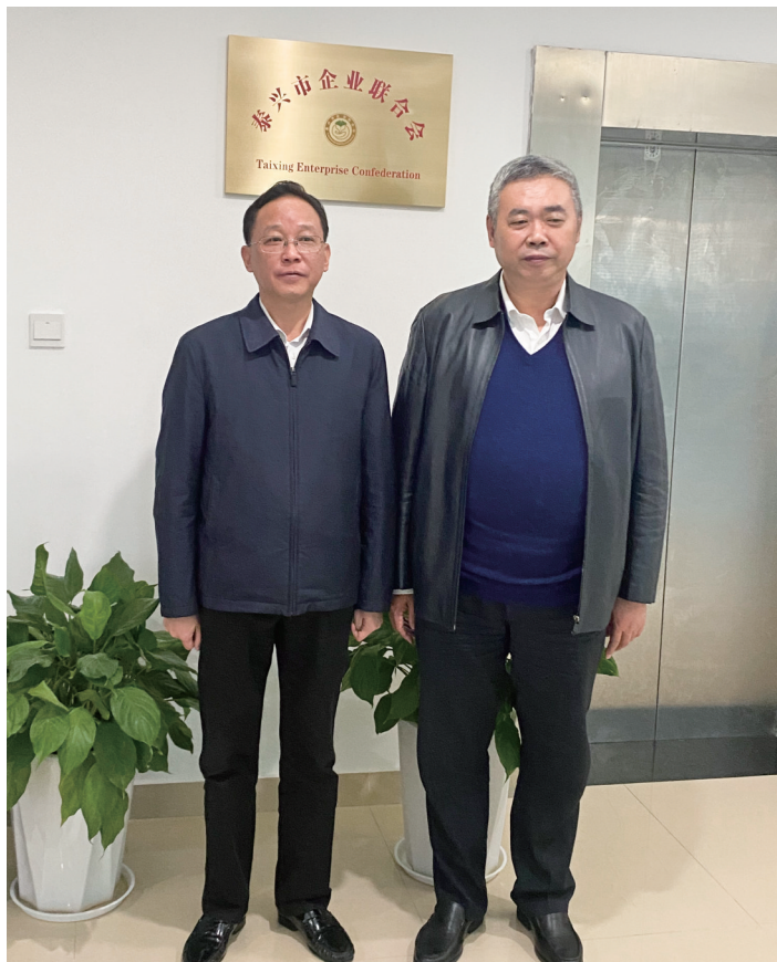
泰兴市委书记张坤和孙云会长合影

常开展活动、发挥职能作用提出了希望和要求:一要围绕中心,服务大局,二要履职尽责,服务企业,三要勇于创新,争当标杆。