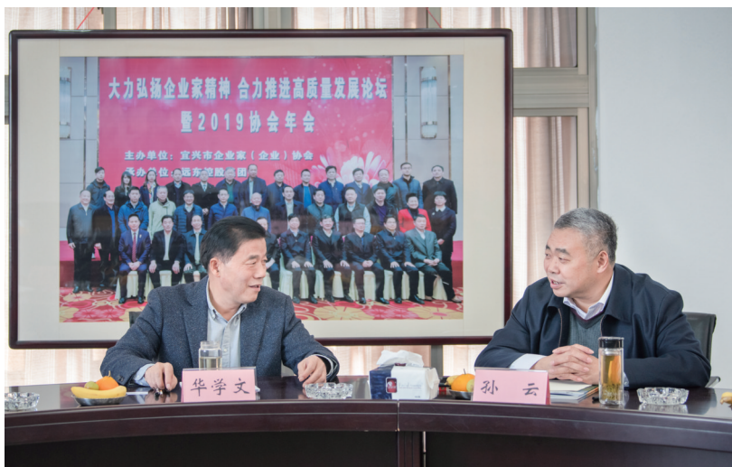
孙云会长与宜兴华学文会长座谈交流